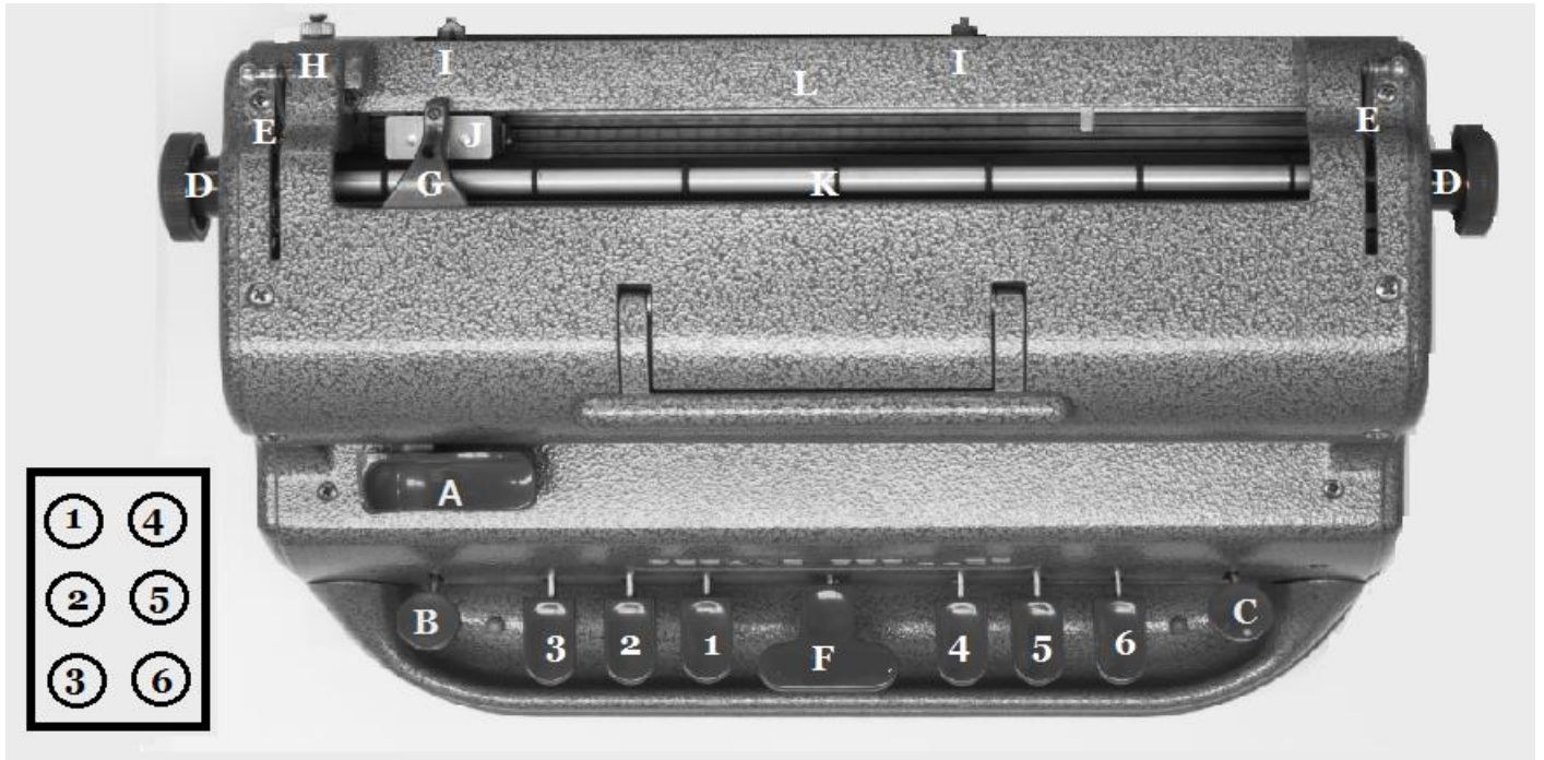
La cellule braille et ses 6 points